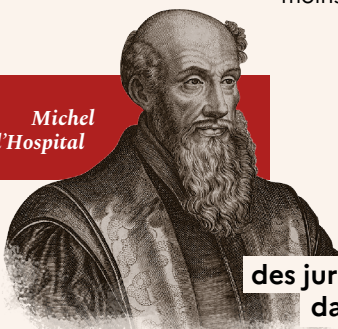
Michel de l'Hospital

À la tête de ces corporations, des « consuls » élus par la collectivité des marchands prêtaient serment, faisaient connaître les règles applicables aux transactions et créaient ainsi un droit plus simple, moins formaliste et plus rapide que le droit romain.